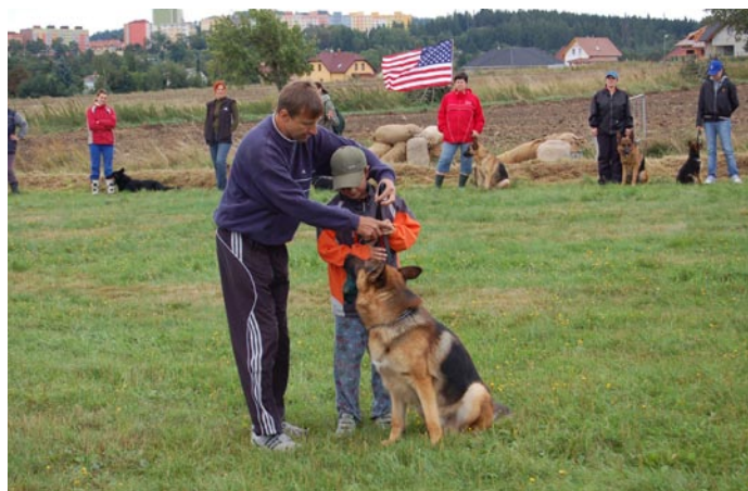
Fotografie z loňské akce Loučení s prázdninami