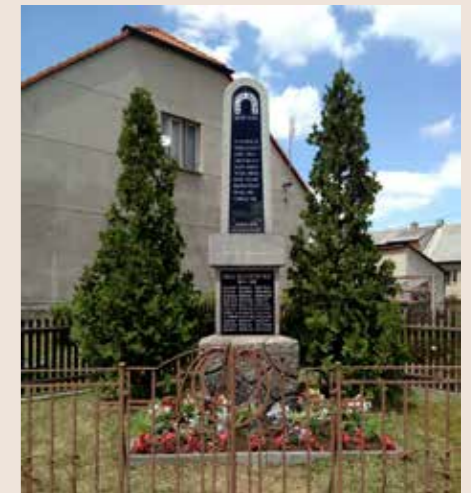
Současná podoba pomníku obětí obou světových válek v Podlesí.

zatčen a 2. 5. 1945 se stal obětí největší hromadné popravy v terezínské Malé pevnosti. Hitlerovci provedli tuto exekuci šest dní před koncem 2. světové války v Evropě a pouhé dva dny před převzetím Terezína Mezinárodním červeným křížem. Památka