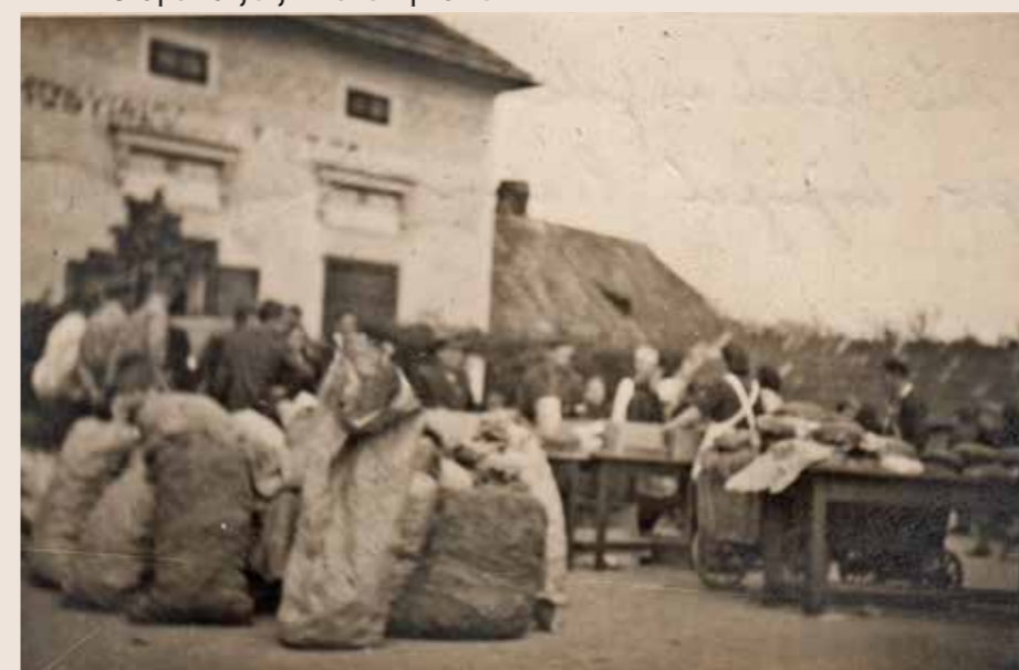
Sbírka na pomoc státu v roce 1938