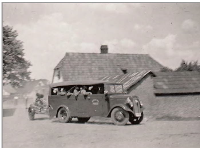
Náves 1947 - hasičské cvičení