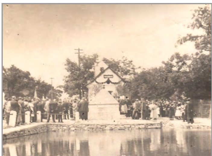
Kaplička v Novém Podlesí