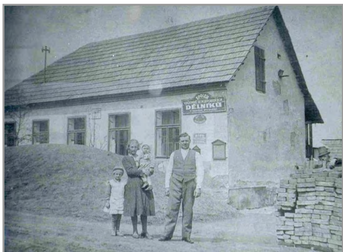
Domek současné hospody Za komínem - rok 1931