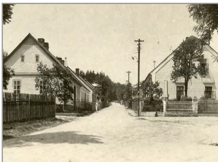
Skurovská ulice - směr Orlov