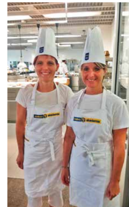
Soutěž o nejlepšího kuchaře

roku 2019 ve společném stravování. V kategorii Nejchutnější svačinky v mateřských školách postoupila