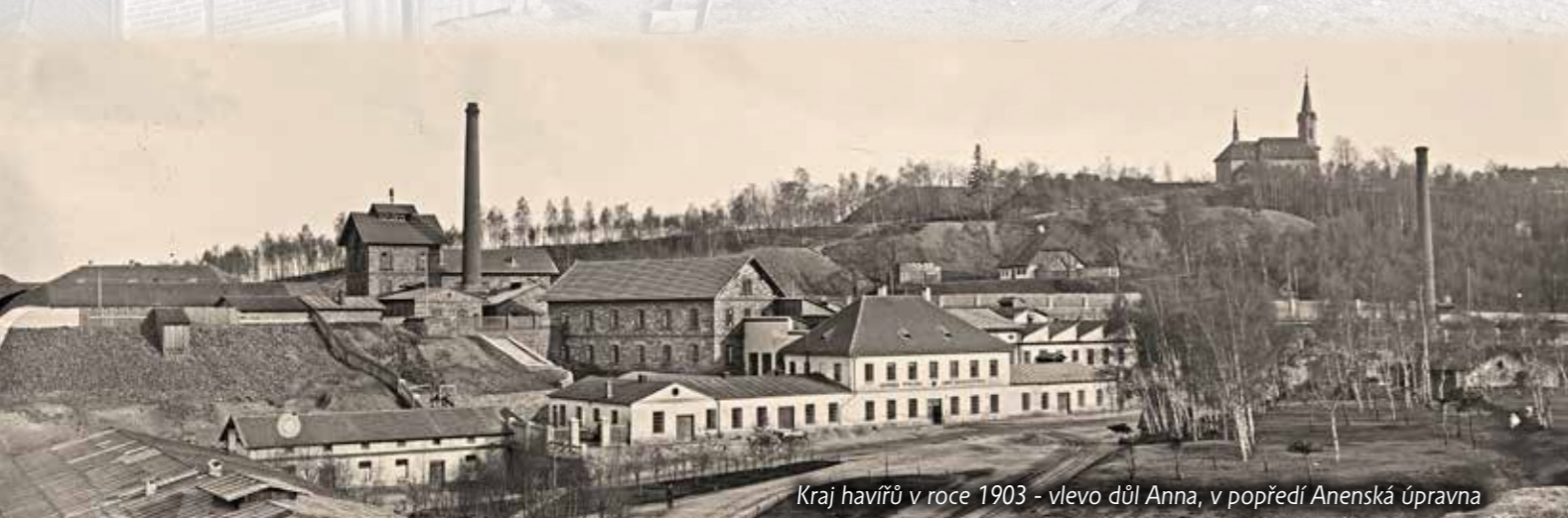
Kraj havířů v roce 1903 - vlevo důl Anna, v popředí Anenská úpravna