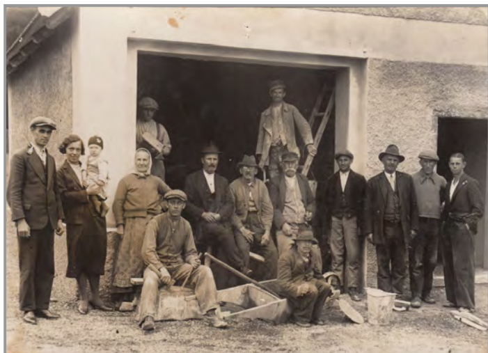
Stavba hasičské zbrojnice v Novém Podlesí 1922