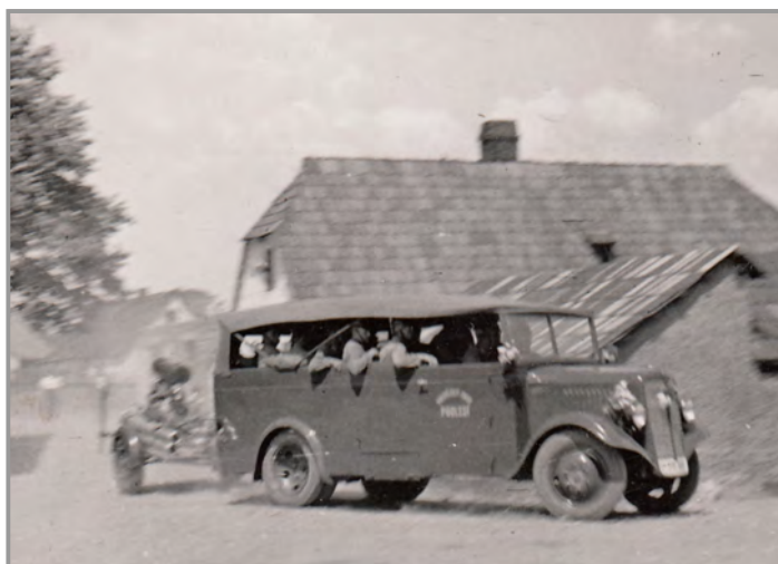
Náves 1947 - hasičské cvičení