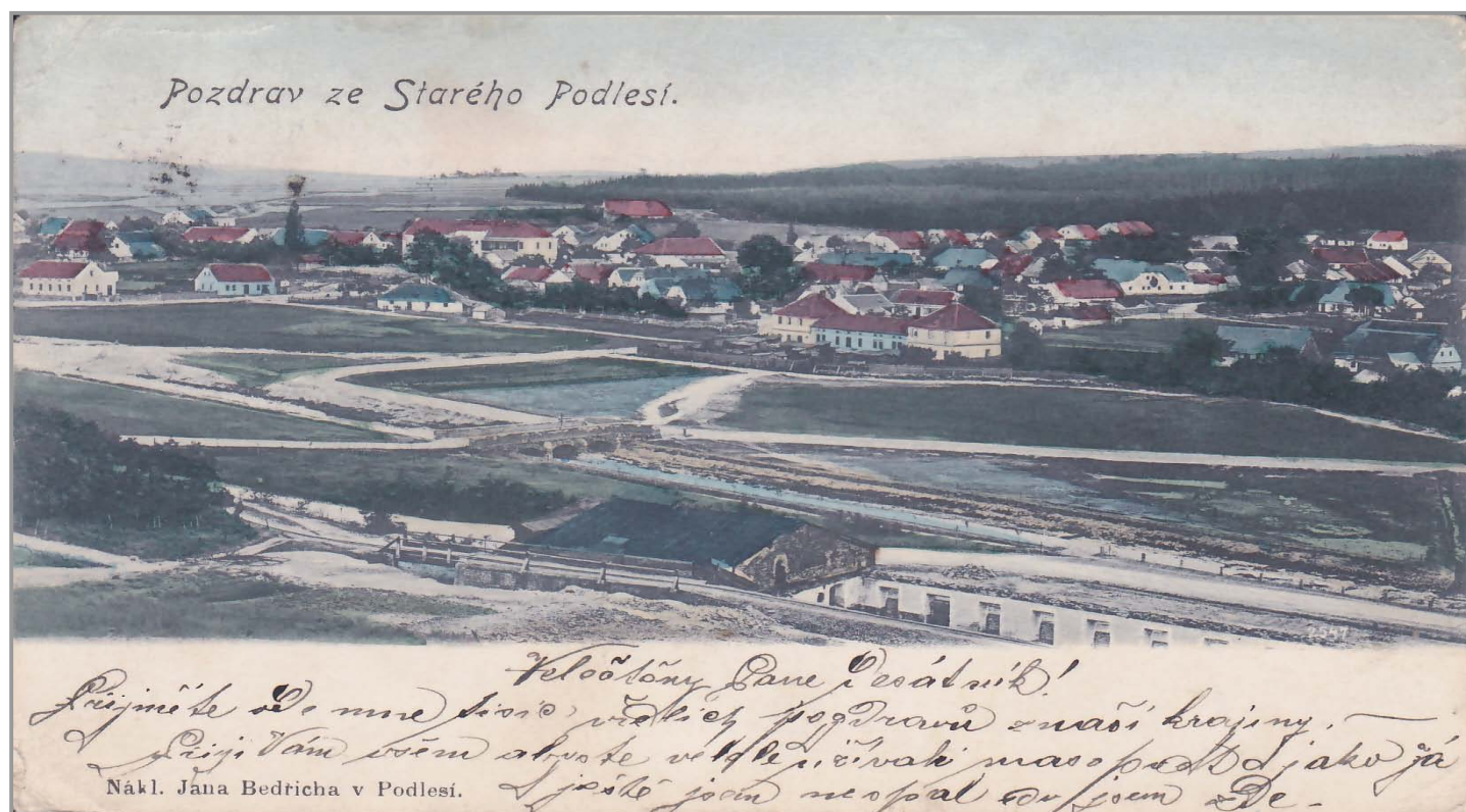
Pohled na Podlesí - rok 1905

Fotografie zaslala starostka obce Marcela Dušková. Pokud byste i vy zachytili v obci nějaký zajímavý okamžik, zašlete svoji fotografii elektronicky na redakční adresu zpravodaj@obecpodlesi.cz