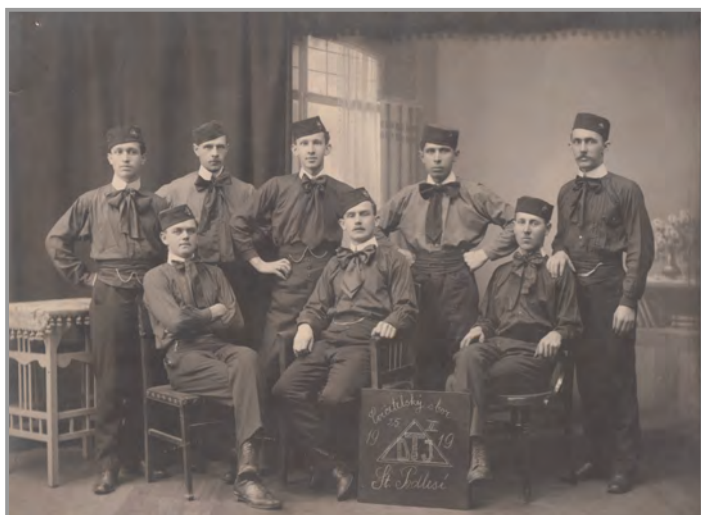
Cvičitel'ský sbor 1919