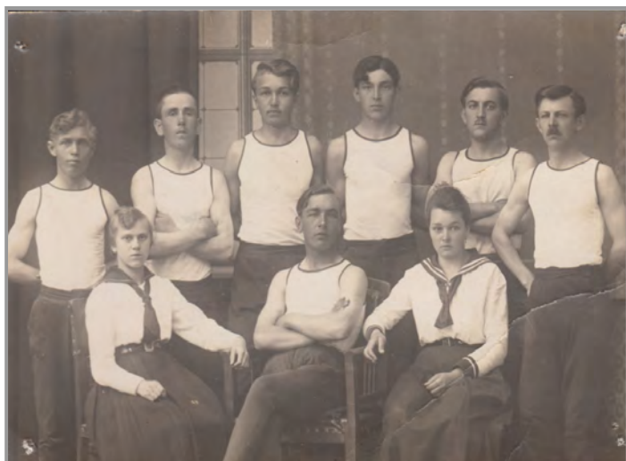
Cvičební sbor DTJ Nové Podlesí

Pokud byste i vy zachytili v obci nějaký zajímavý okamžik, zašlete svoji fotografii elektronicky na redakční adresu zpravodaj@obecpodlesi.cz .