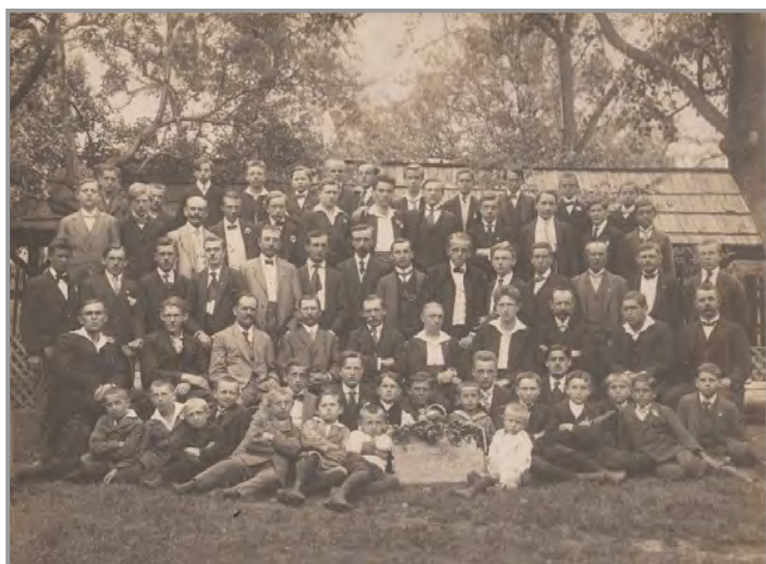
TJ Sokol muži