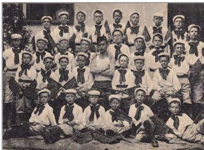
DTJ Podlesí - žáci, 28. 6. 1914