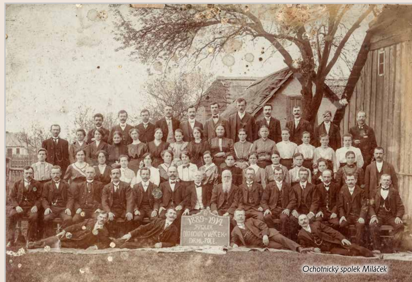
Ochotnický spolek Miláček