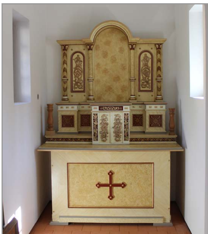
Oltář v kapličce v Novém Podlesí