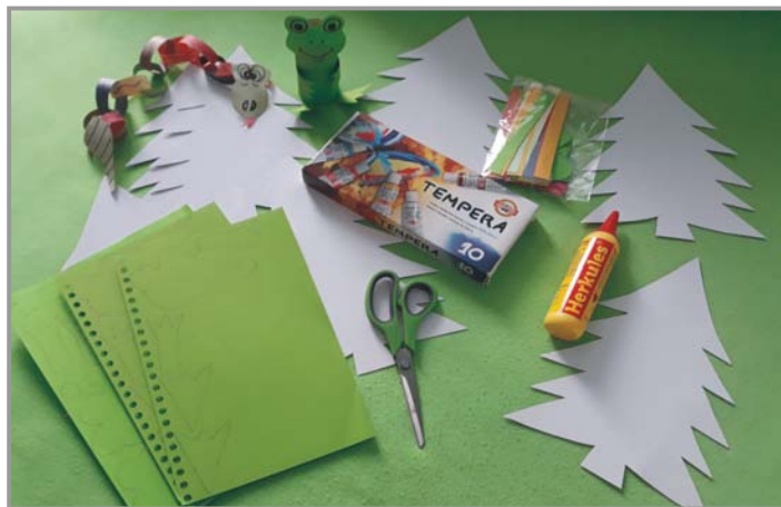
Potřeby k vyrábění