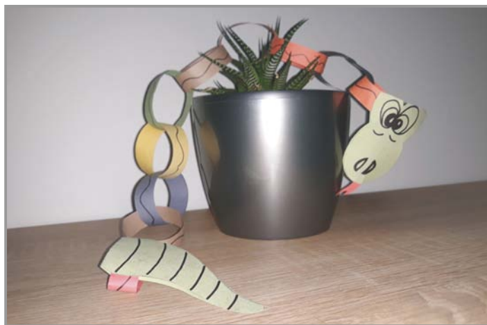
Lepení papírových hadů