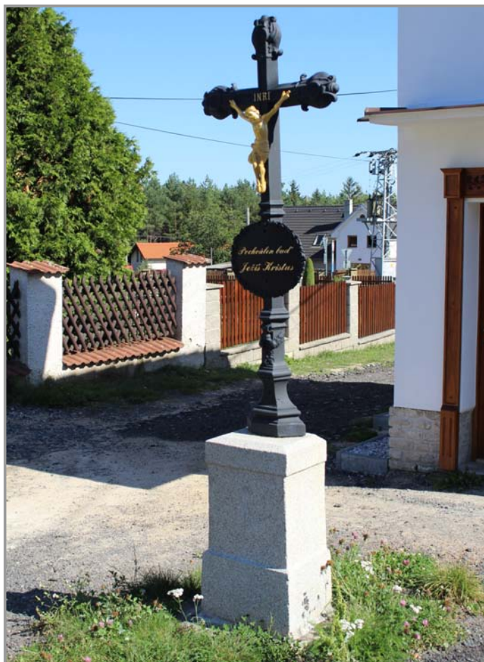
Křížek před kapličkou v Novém Podlesí