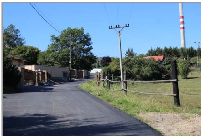
„Prostřední“ komunikace mezi Starým a Novým Podlesím