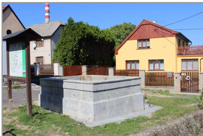
Historická kašna u kapličky v Novém Podlesí