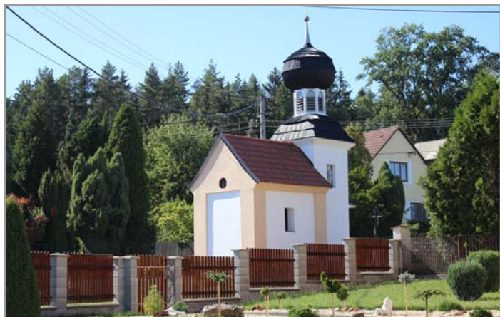
Kaplička Nové Podlesí