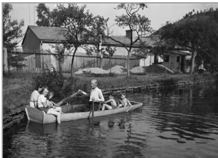
Rok 1956 - nádržka Hospoda

PODLESÁK ■ Čtvrtletník ■ Své příspěvky zasílejte na adresu zpravodaj@obecpodlesi.cz