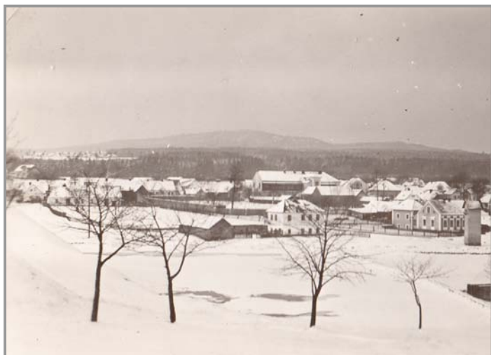
Pohled na Podlesí z haldy