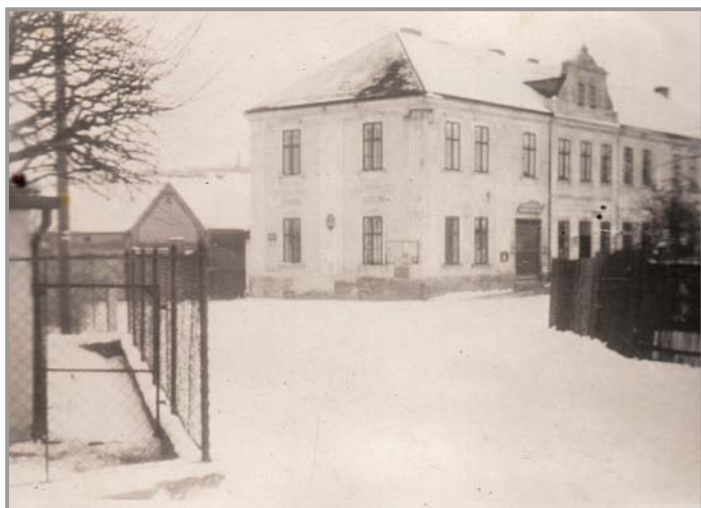
Hostinec pana Antropiuse