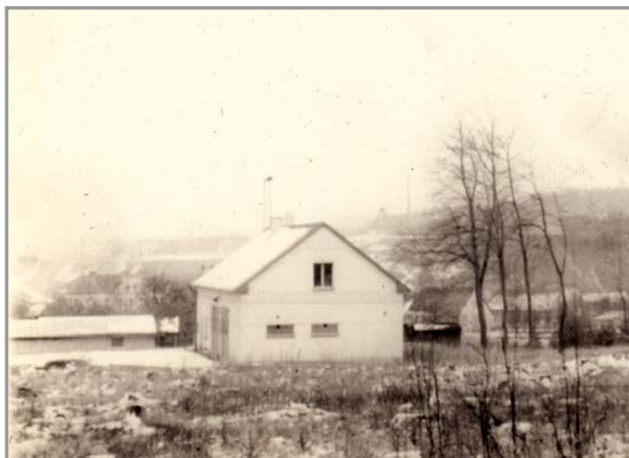
Pohled na hasičskou zbrojnici