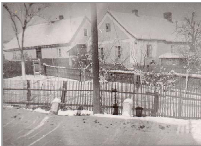
Domky pod Coopem - pohled od zastávky

Fotografie zaslala starostka obce Marcela Dušková. Pokud byste i vy zachytili v obci nějaký zajímavý okamžik, zašlete svoji fotografii elektronicky na redakční adresu zpravodaj@obecpodlesi.cz