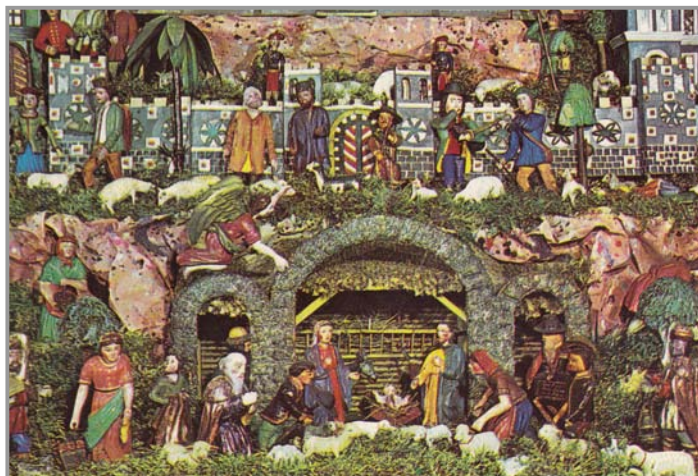
Příbramské jesličky s daráky ze dřeva, vyřezal Augustin Rotek ze Starého Podlesí

PODLESÁK ■ Čtvrtletník ■ Své příspěvky zasílejte na adresu zpravodaj@obecpodlesi.cz